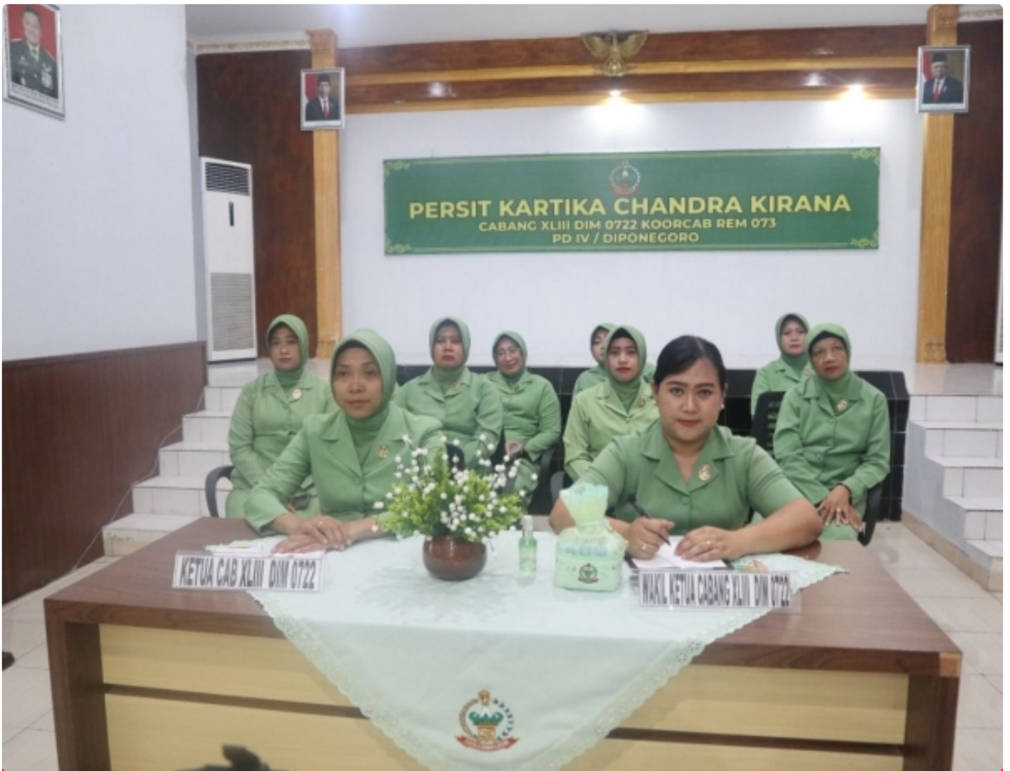
Persit Cab XLIII Dim Kudus Ikuti Webinar Tentang Hukum KDRT, LGBT Dan Perselingkuhan